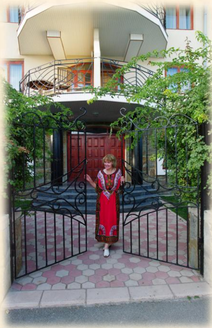
Pentax K20 5 – У врат 10 корпуса ТОК «Судак»

Двое интересующихся граждан разного возраста и пола зашли в наш увитый розами дворик, дабы поинтересоваться ценой. Уходили сильно разочарованными. Да уж, недешев отдых в люксовых номерах ТОК «Судак». Не мог бы позволить еще 2 года назад. А теперь думаю о новой поездке после возвращения домой. Если представить наш отель как хрущевскую 5-этажку, то люди не смотрят на нее, а если снять «паранджу» или навести «морок» в виде Тадж-Махала, то все наоборот.