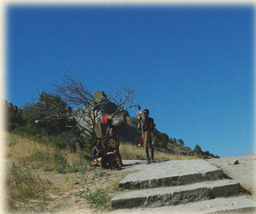
Pentax K20 6 – Откуда зулусы в Амбере?

Пасьянс отправляет нас на Канары. Я бы не возражал.