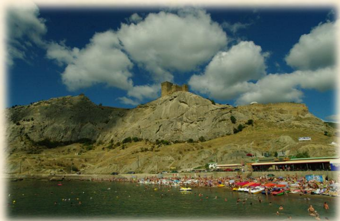
Pentax K20 1 – Развалины Амбера

В аэропорту купил «зенитовские» панаму, мячик и шоколад. Все было кстати. Спускаясь по трапу в Симферополе, жена сказала - «Ненавижу». Это об окутавшей нас жары. Но вот прохладное нутро лимузина, везущего нас к морю. Куплено вино, арбуз, дыня и виноград. Мы в шикарном, по крымским меркам, отеле, всего в 50 метрах от берега собственного пляжа.