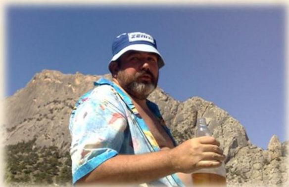
Nokia N95 1 – автор устал и выпил...