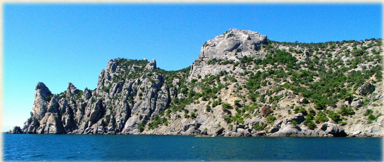
Pentax K20 4 — «Новый Свет»